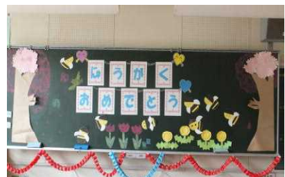
ていねいな教室の飾り付け