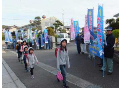
リーダーを中心に集団登校