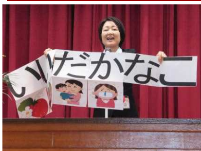
新任式で工夫した自己紹介