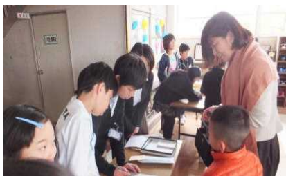
やさしく迎えてくれた6年生