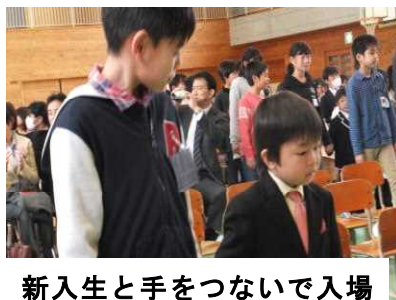
新入生と手をつないで入場