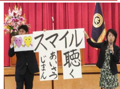
スマイルのステージはあいさつと聴くことにいっぱい取り組みます