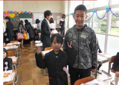
6年生が1年生のお手伝い