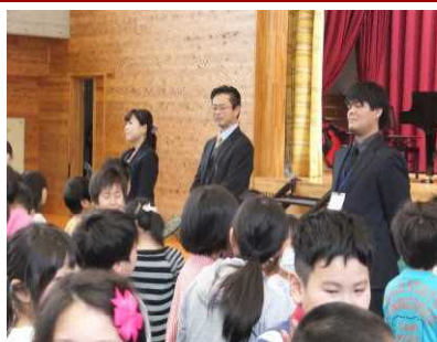
学級担任の発表にどきどき、わくわくの子どもたち