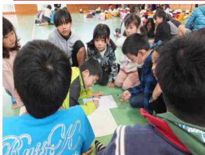
支部別児童集会で班員の確認