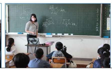
コロナウイルスについて正しい知識も学びました。