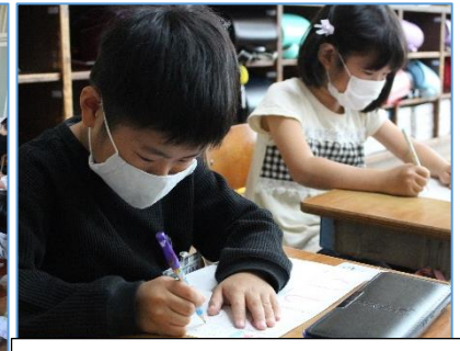
ひらがなの勉強、始めました。