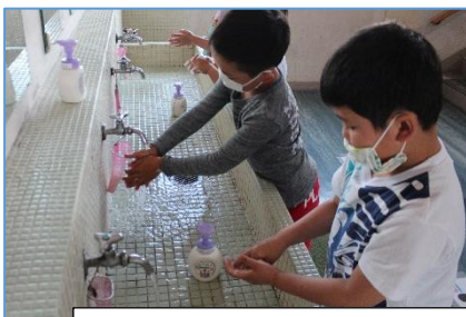
しっかり手洗い。順番は距離をとって待ちます。