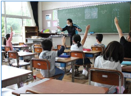
1年生の様子。左が分散登校時。右が全員そろった様子。

4月9日から続いた休校を経て、ようやく学校再開。子供たちは元気に学校生活を送っています。